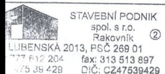
Aleš Příbyl jednatel